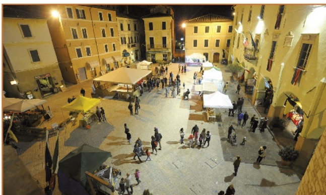
Successo di presenze per l'edizione 2013 di Festival