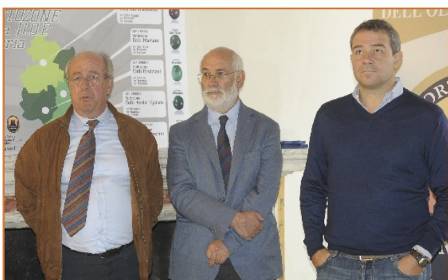
All'inaugurazione della sede del Consorzio Regionale dell'Olio DOP Umbria presso Villa Fabri