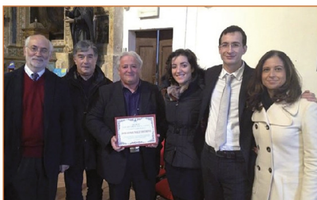
Alla cerimonia di premiazione del Volontario dell'Anno riconoscimento assegnato all'AVIS Comunale Trevi