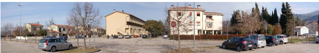
Foto n. 7 – Veduta a visuale ampia dal parcheggio posto su Via Gramsci degli edifici che vi affacciano. Trattasi degli interventi edilizi eseguiti a partire dagli anni 60/70 del novecento e sino all'anno 2000. Data scatto: 05.01.2019