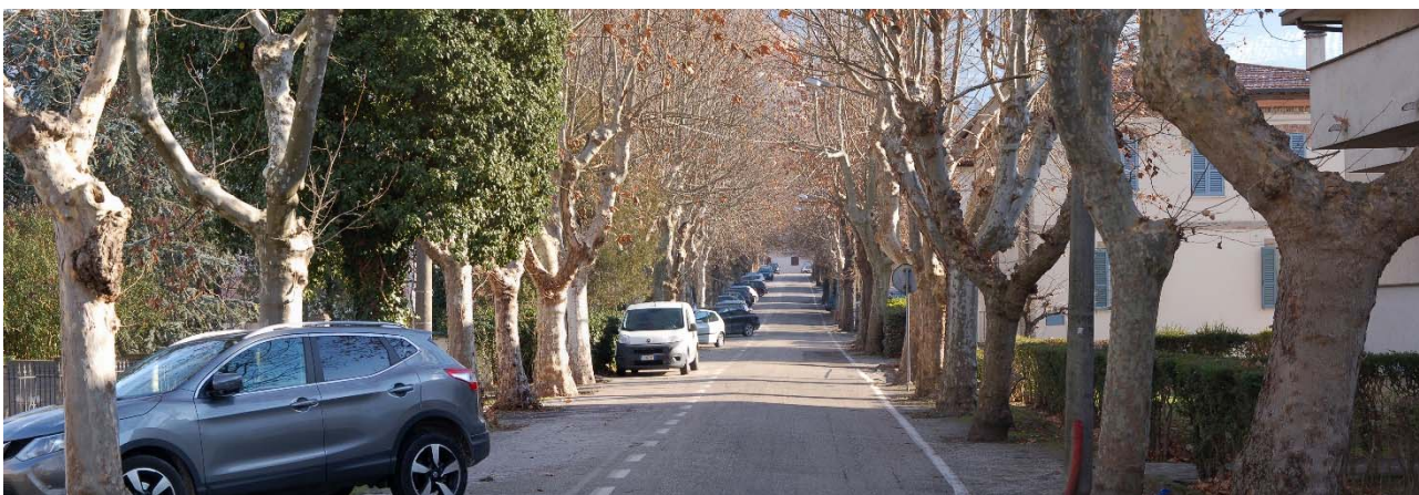
Foto n. 6 – Veduta a visuale ampia dalla sezione terminale del Viale della Stazione in direzione est. Nonostante la spolazione stagionale delle alberature di platano poste lungo il Viale della Stazione, l'area d'intervento e gli edifici che vi insistono non sono visibili. Data scatto: 05.01.2019