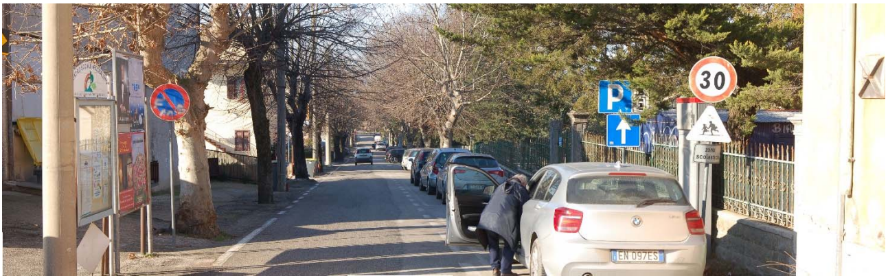
Foto n. 9 – Veduta a visuale ampia dalla sezione di monte del Viale della Stazione. Nonostante la perdita del fogliame delle alberature di platano, l’area d’intervento e gli edifici che vi insistono non sono visibili. Data scatto: 05.01.2019