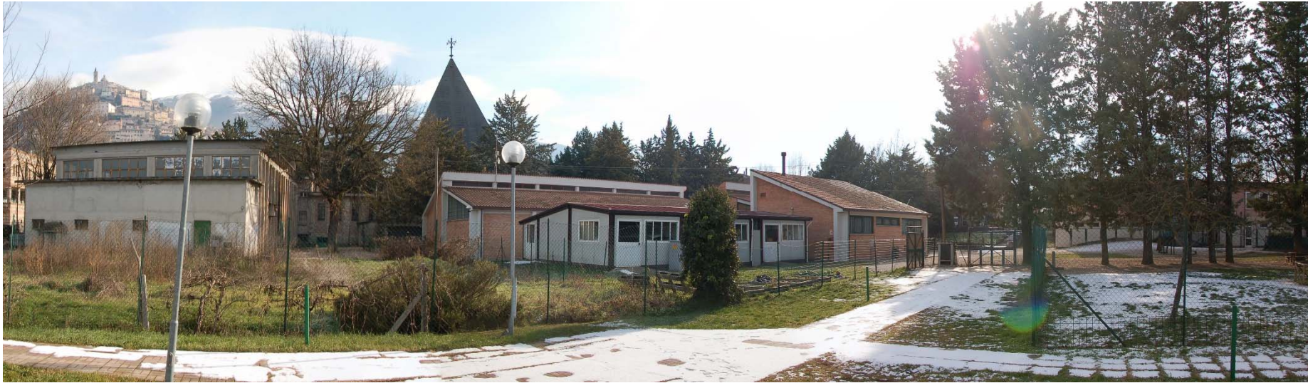
STATO ATTUALE di cui alla precedente Foto n. 13 Veduta a visuale ampia dall'area a verde pubblico attrezzato