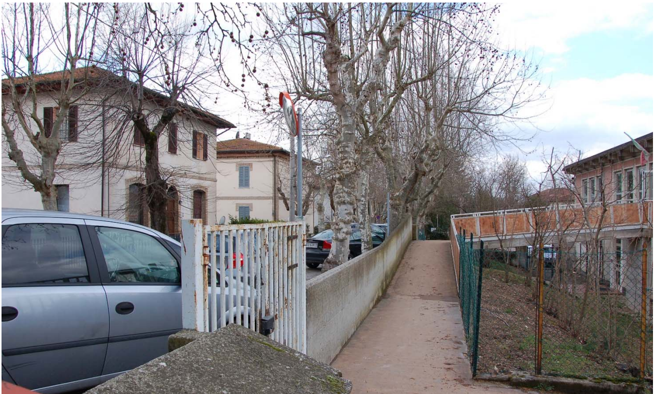
Foto n. 41 – Veduta dell'ingresso pedonale all'area scolastica dal Viale della Stazione.

Dall'immagine è desumibile il significativo esistente dislivello tra la quota d'imposta degli edifici scolastici e la quota del Viale della Stazione (3,71 m). Come pure è ben apprezzabile l'importanza delle coperture, sul piano percettivo e figurativo, che divengono il quinto prospetto dell'edificato, esistente e di progetto. In tal senso si rimanda ai contenuti della nota di accompagnamento della precedente Foto n. 11. Data scatto: 13.03.2015