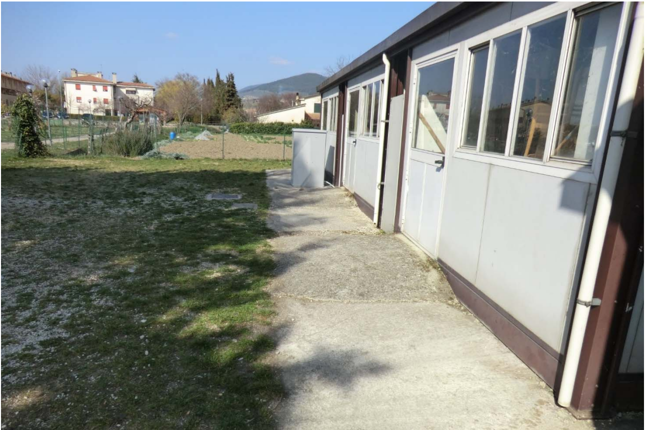
Foto n. 34 – Veduta dei moduli prefabbricati posti all'interno dell'area scolastica di cui si prevede la demolizione/rimozione (veduta in direzione nord). Data scatto: 13.03.2015