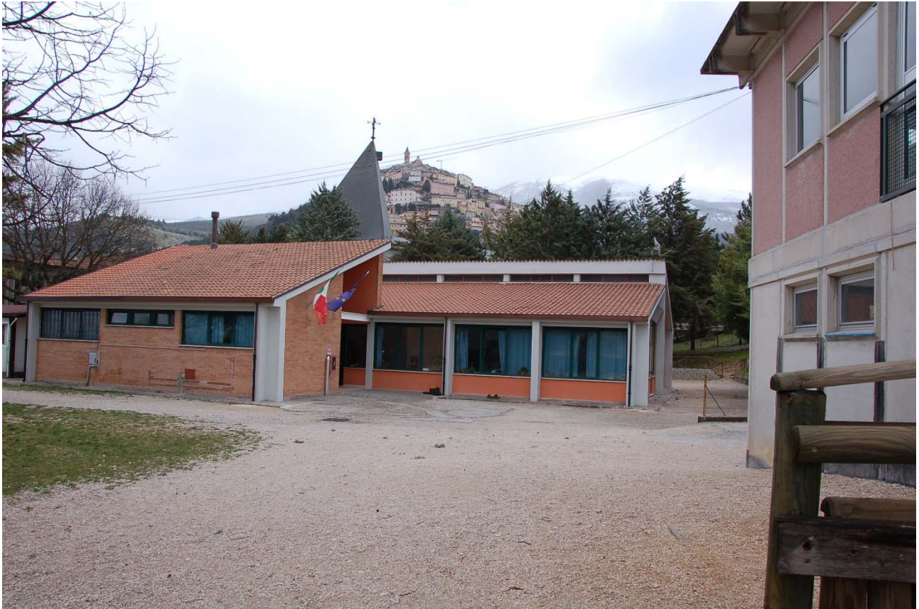
Foto n. 46 – Veduta in direzione est dell'area scolastica e dell'edificio della scuola elementare. Data scatto: 13.03.2015