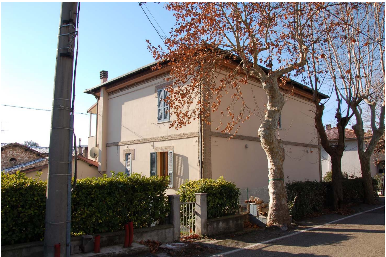
Foto n. 19 – Veduta del lato a monte del secondo edificio posto sul lato destro di Viale della Stazione.