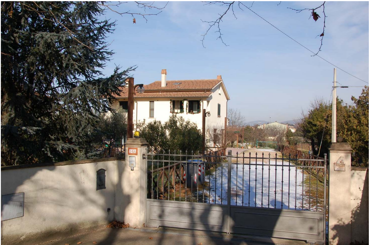
Foto n. 16 – Veduta del primo edificio posto sul lato sinistro di Viale della Stazione, risalendo verso monte, con accesso dal viale stesso.