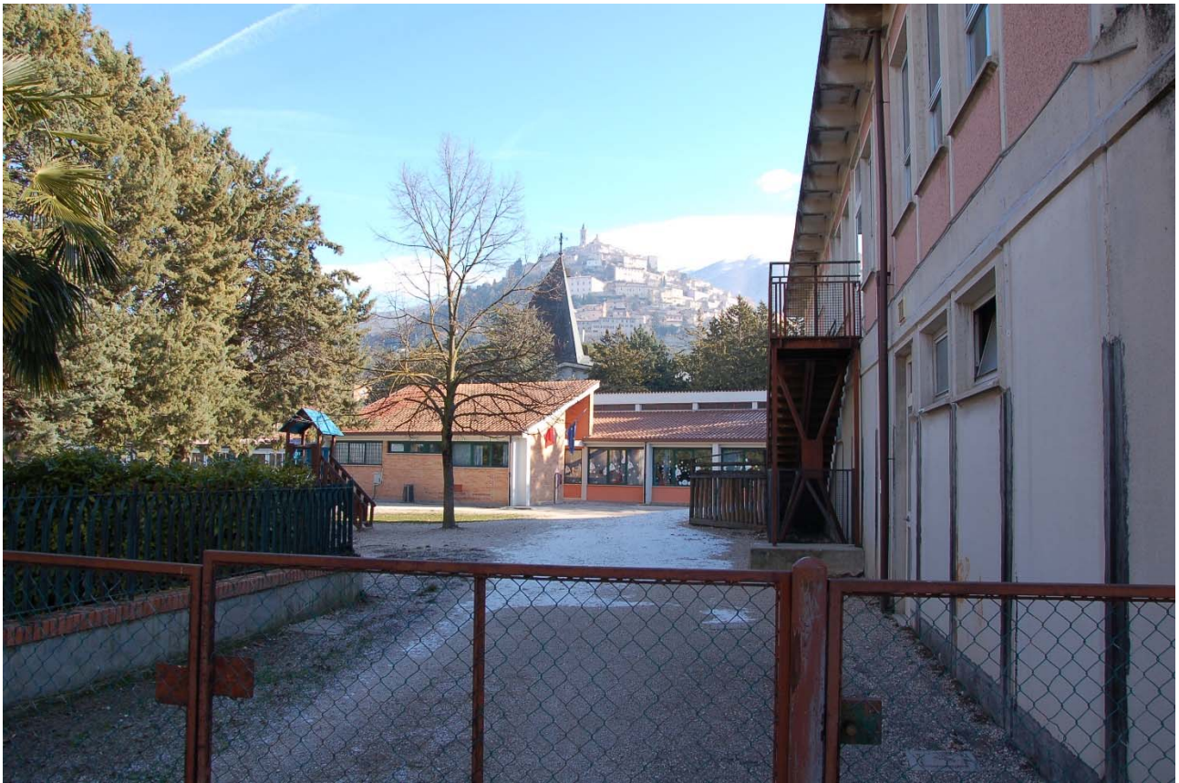
Foto n. 48 – Veduta in direzione est dell'area scolastica e dell'edificio della scuola elementare. Data scatto: 05.01.2019