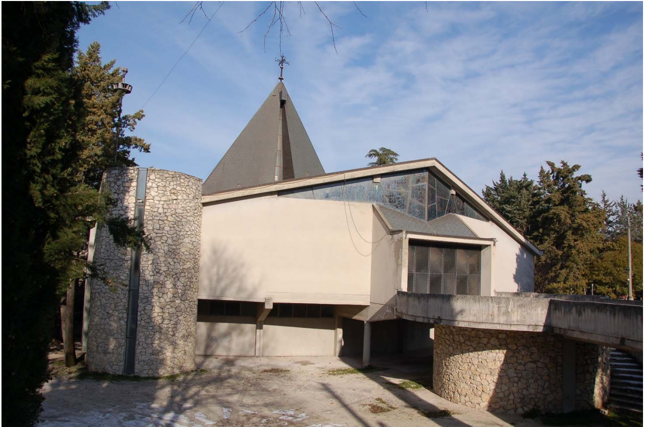
Foto n. 24 – Veduta da valle dell'ingresso alla Chiesa della Sacra Famiglia. Data scatto: 05.01.2019