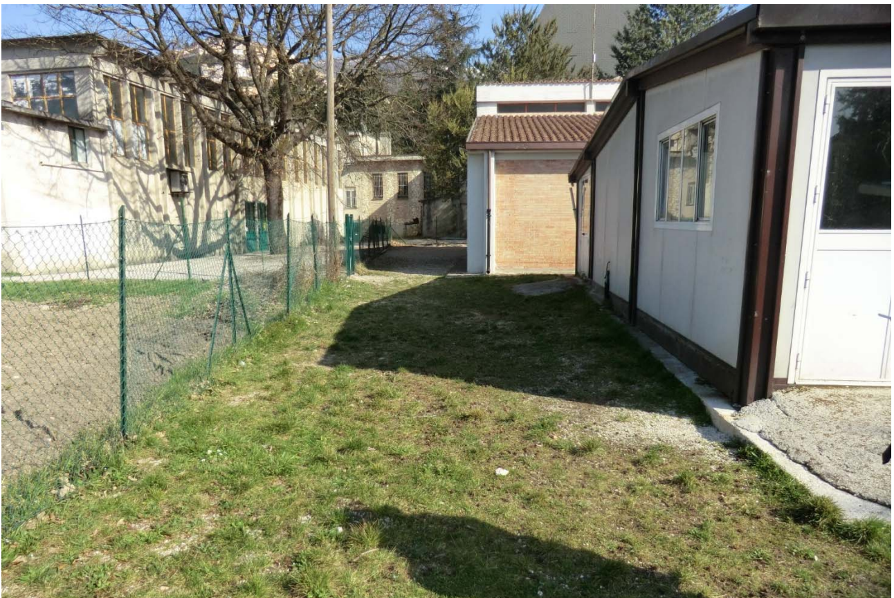
Foto n. 35 – Veduta in direzione est della zona di confine tra l'area scolastica e relativi edifici (a destra) e i terreni ed edifici di proprietà ecclesiastica. Data scatto: 13.03.2015