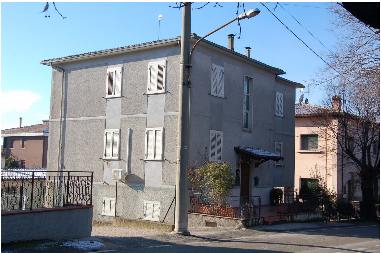
Foto n. 25 – Veduta del sesto edificio posto sul lato destro di Viale della Stazione, risalendo verso monte. Data scatto: 05.01.2019