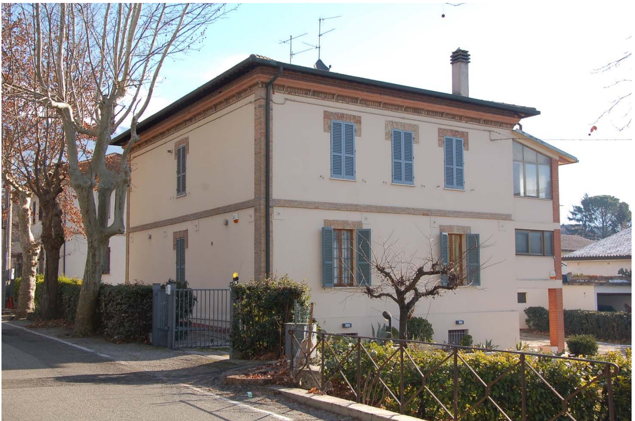
Foto n. 15 – Veduta del secondo edificio posto sul lato destro di Viale della Stazione, risalendo verso monte. Data scatto: 05.01.2019