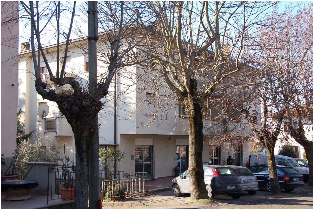
Foto n. 22 – Veduta del quarto edificio posto sul lato destro di Viale della Stazione, risalendo verso monte, posto di fronte all'attuale accesso pedonale all'area scolastica. Data scatto: 05.01.2019