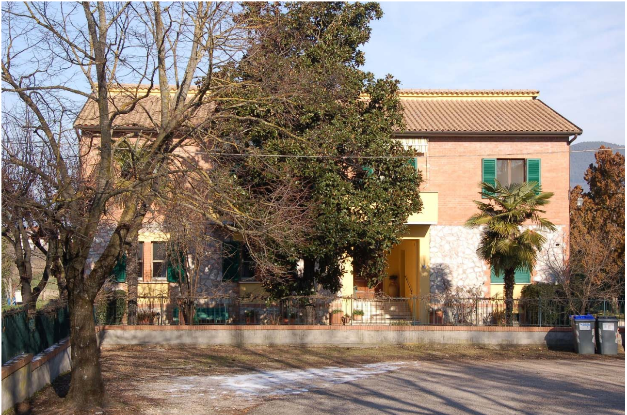
Foto n. 18 – Veduta del secondo edificio posto sul lato sinistro di Viale della Stazione, risalendo verso monte, contiguo all'area d'intervento.