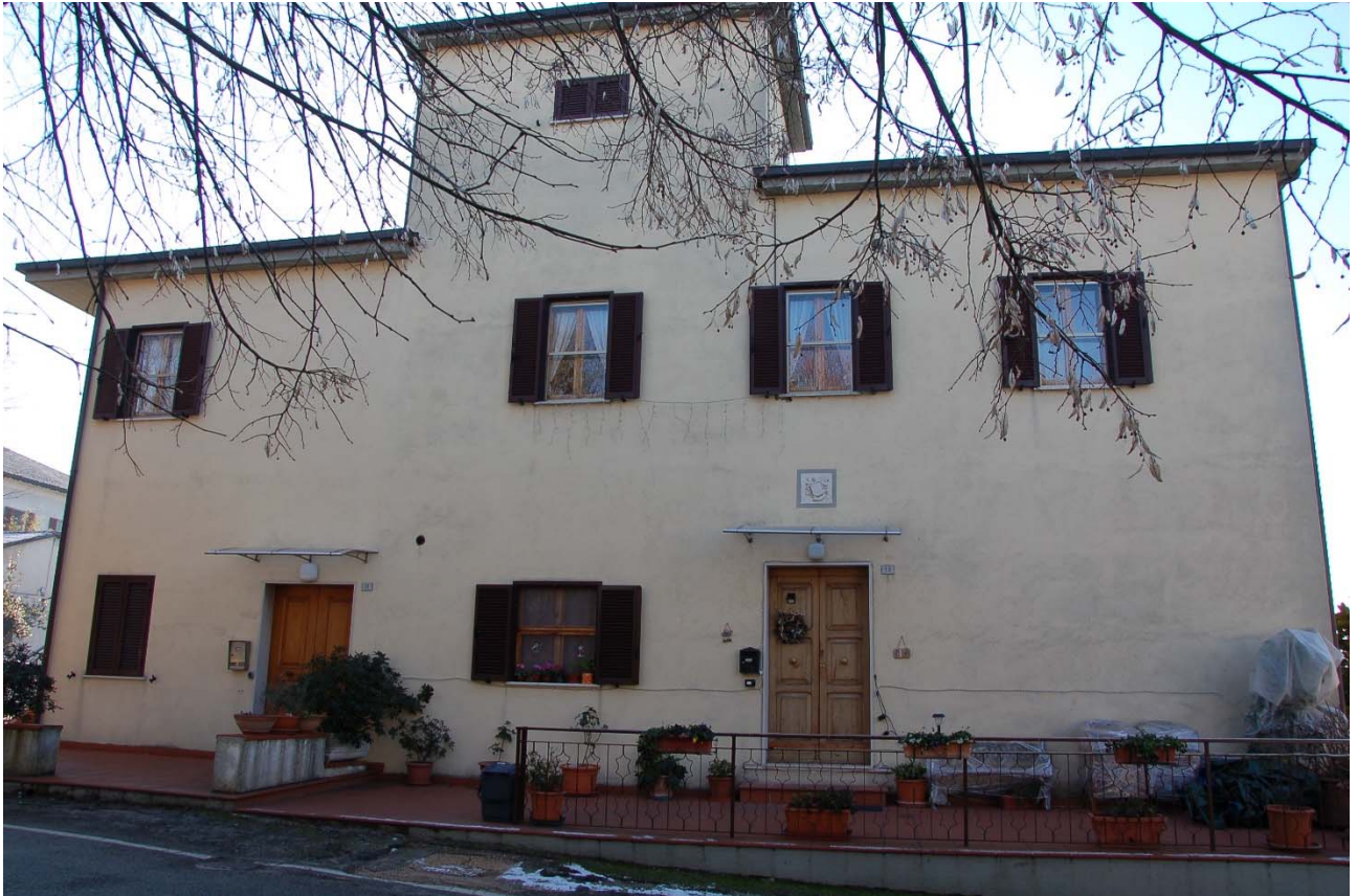
Foto n. 26 – Veduta del settimo edificio posto sul lato destro di Viale della Stazione, risalendo verso monte. Data scatto: 05.01.2019