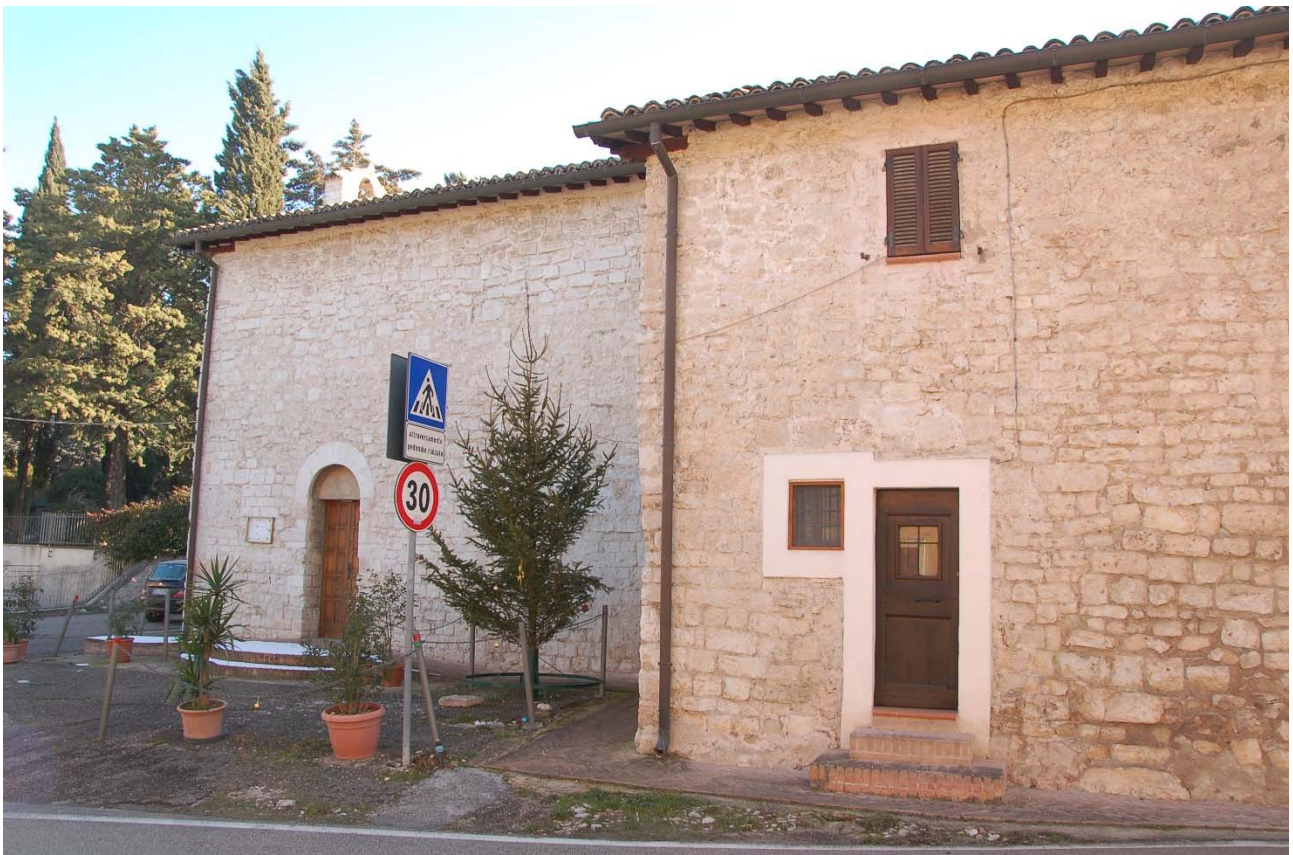
Foto n. 31 – Veduta della Chiesa di Sant'Egidio da Via Sant'Egidio.