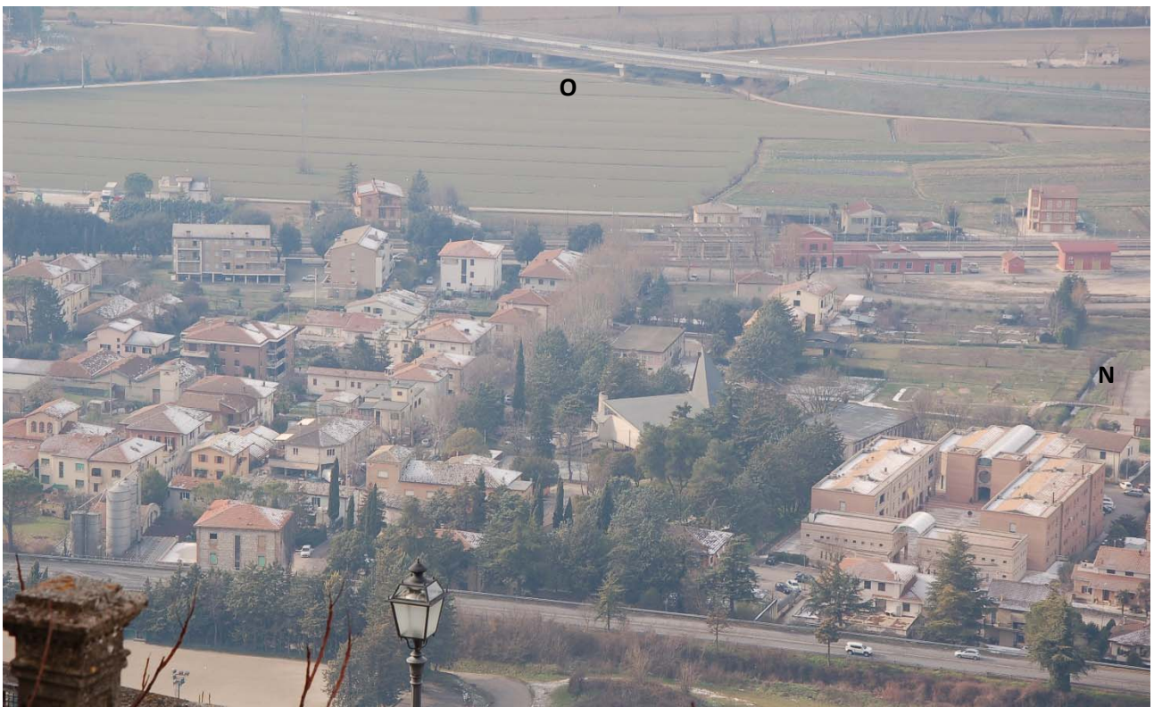
Foto n. 4 – Veduta da punto panoramico posto sul terrazzamento superiore a Via Fantosati.

Dell'area d'intervento sono parzialmente visibili: l'esistente edificio a due piani della scuola materna; la porzione di area d'intervento posta ad ovest dell'edificio stesso (attuale parcheggio che sarà trasformato in area a verde e sede della greenway alberata); la porzione nord dell'area d'intervento (a destra rispetto alla copertura dell'aula liturgica della Chiesa). L'attuale scuola elementare, avente massima altezza identica agli edifici di progetto, non è visibile. Data scatto: 05.01.2019