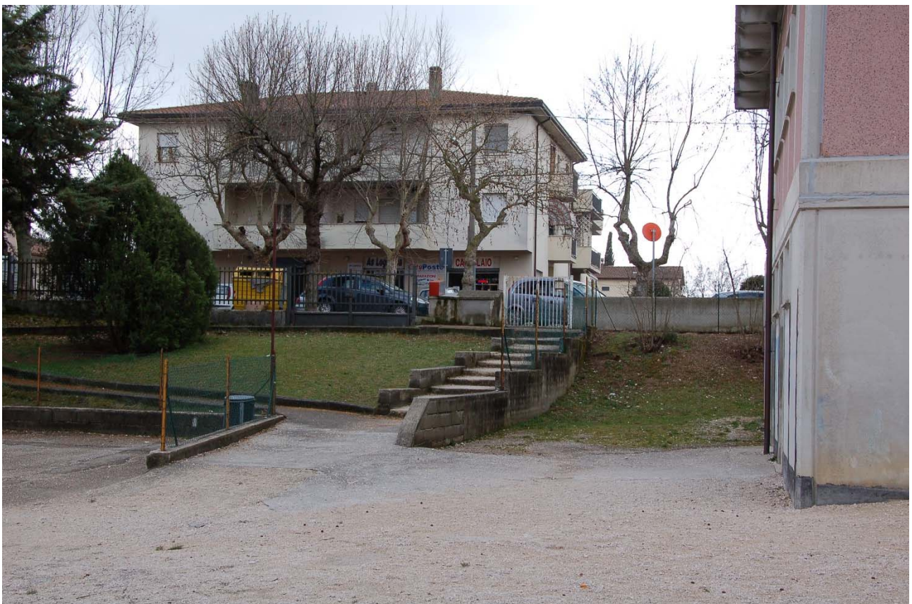
Foto n. 47 – Veduta in direzione sud dell'ingresso pedonale all'area scolastica dal Viale della Stazione. Data scatto: 13.03.2015