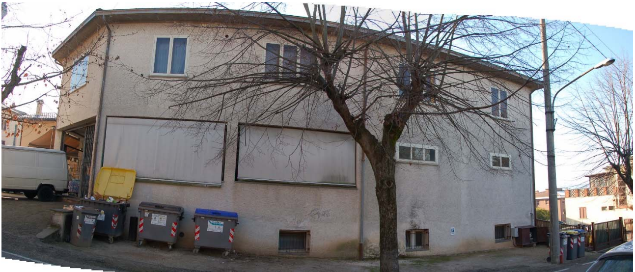
Foto n. 28 – Veduta a visuale ampia dell’ottavo e ultimo edificio posto sul lato destro di Viale della Stazione, risalendo verso monte, collocato sull’incrocio tra il Viale della Stazione e la Via Sant’Egidio. Data scatto: 05.01.2019