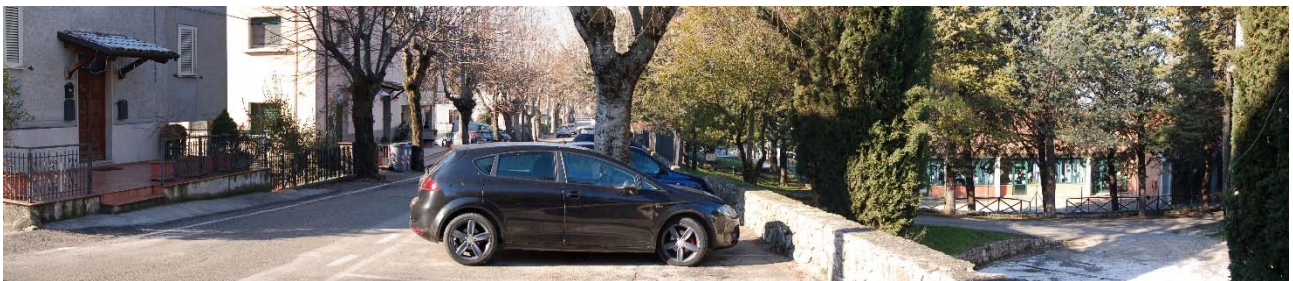
Foto n. 10 – Veduta a visuale ampia dal punto di accesso pedonale all’area della Chiesa Parrocchiale della Sacra Famiglia. Le folte alberature sempreverdi poste sull’area pertinenziale del complesso parrocchiale riducono sensibilmente la percepibilità dell’ala dell’edificio della scuola elementare che affaccia in direzione della Chiesa. La riduzione percettiva è amplificata dall’esistente dislivello tra il piano d’imposta della Chiesa e quello della scuola elementare. Data scatto: 05.01.2019