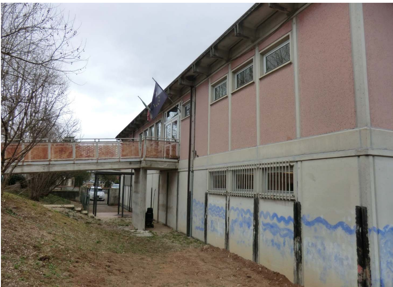
Foto n. 33 – Veduta dell'edificio della scuola materna di cui si prevede la demolizione, lato affacciato sul Viale della Stazione. Data scatto: 13.03.2015