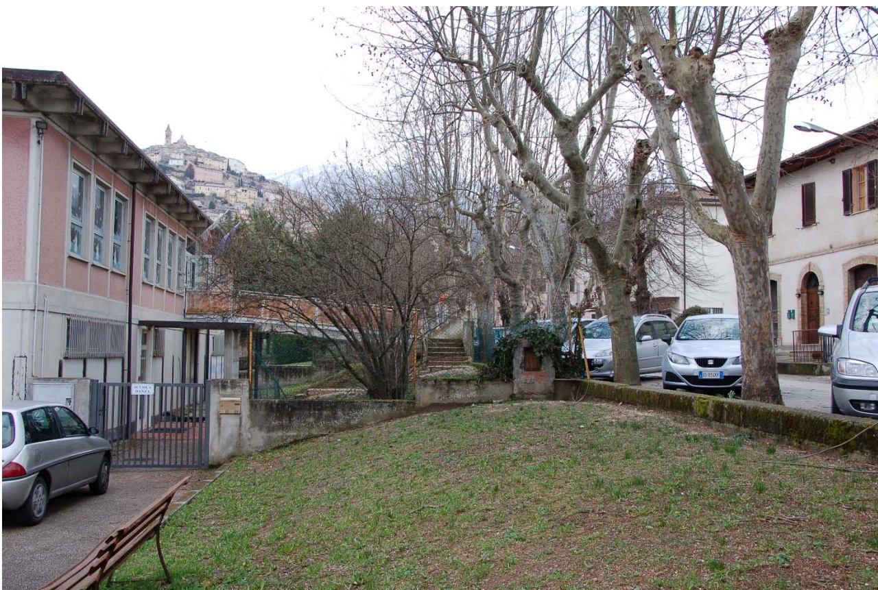
Foto n. 43 – Veduta, in direzione est, dell'area posta tra la scuola materna e il Viale della Stazione. Data scatto: 13.03.2015