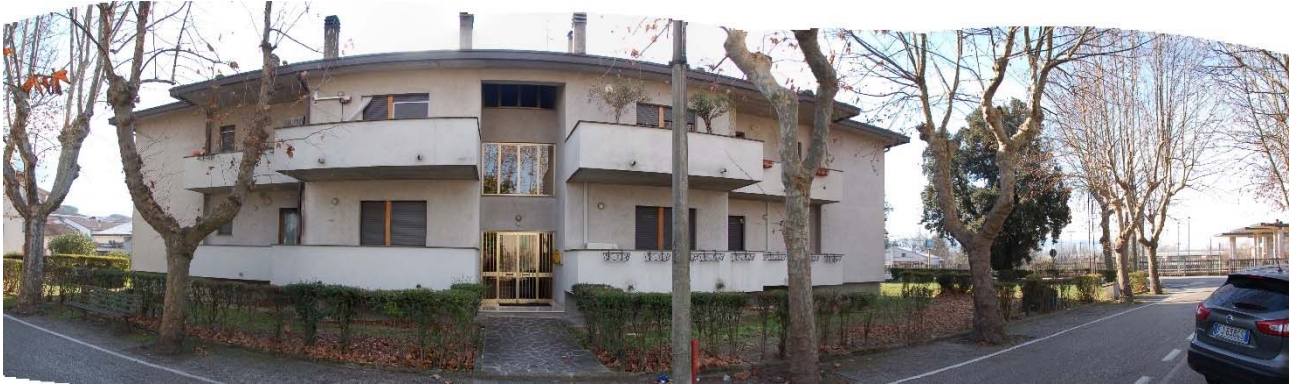
Foto n. 14 – Veduta a visuale ampia del primo edificio posto sul lato destro di Viale della Stazione nella sua sezione di partenza posta a valle, in prossimità della linea ferroviaria Roma-Ancona. Data scatto: 05.01.2019