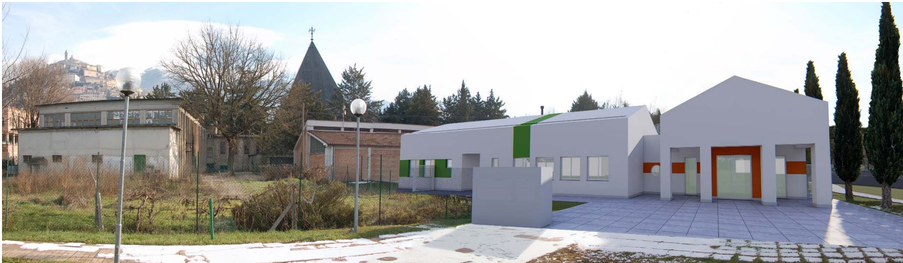
FOTOINSERIMENTO DEL PROGETTO