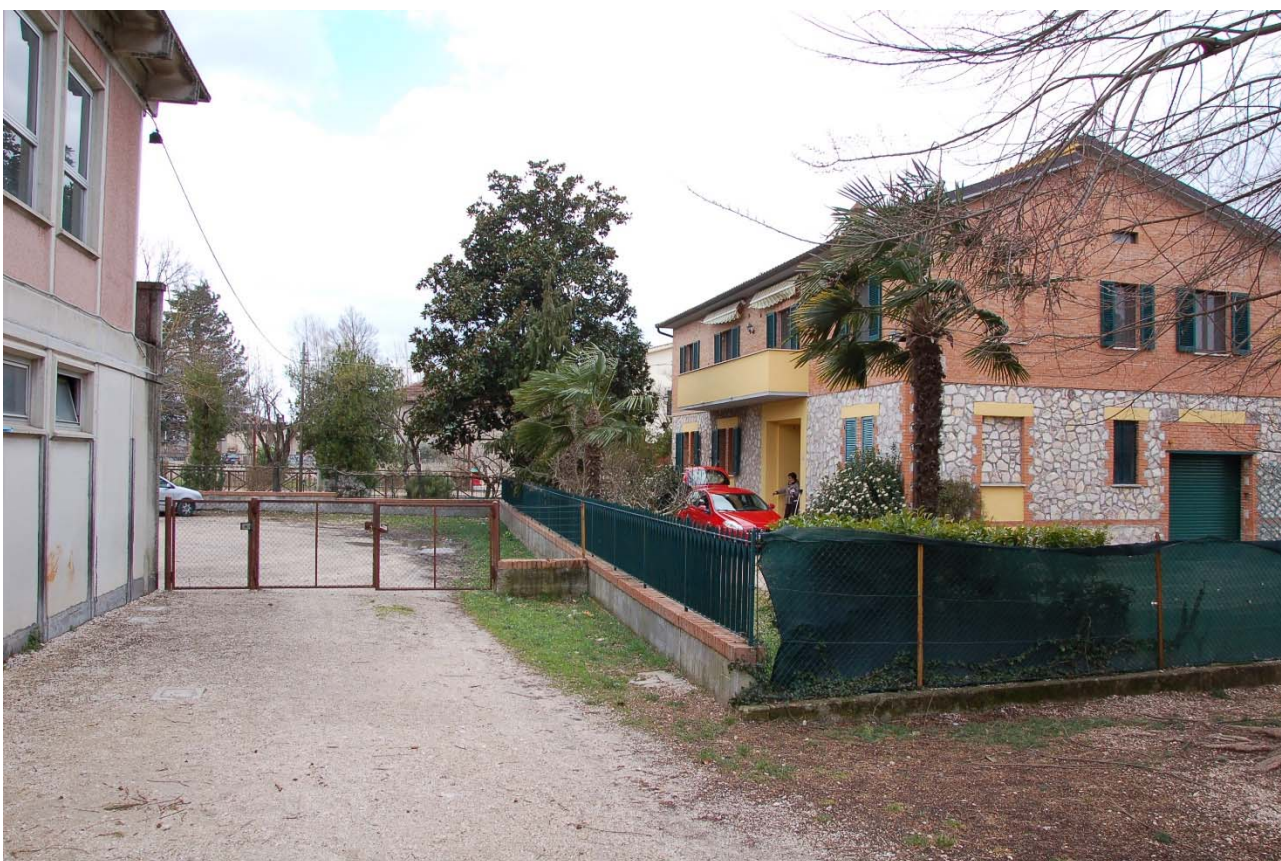
Foto n. 45 – Veduta dell'area scolastica compresa tra l'edificio della scuola materna e l'immobile privato a destinazione residenziale. Data scatto: 13.03.2015