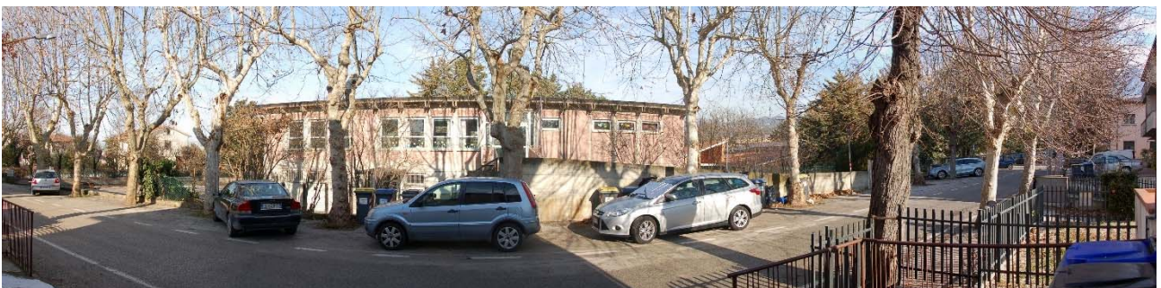
Foto n. 21 – Veduta a visuale ampia del prospetto dell'edificio della scuola materna di cui si prevede la demolizione, ripreso dall'ingresso del frontistante immobile di cui alla foto che precede. Data scatto: 05.01.2019