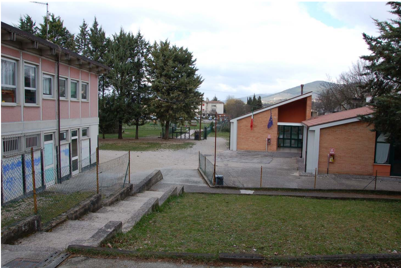
Foto n. 42 – Veduta, in direzione nord e dall'ingresso pedonale all'area scolastica, dell'area stessa e degli edifici ivi insistenti. Data scatto: 13.03.2015