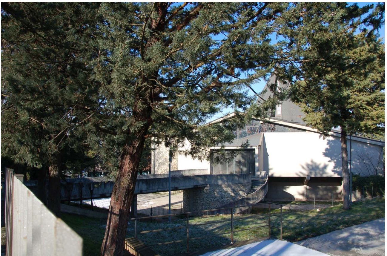
Foto n. 27 – Veduta da monte dell'ingresso alla Chiesa della Sacra Famiglia. Data scatto: 05.01.2019