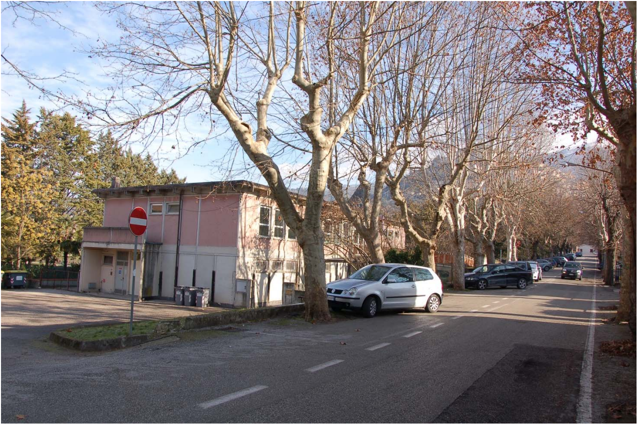
Foto n. 50 – Veduta in direzione est-nord est del parcheggio scolastico e del viale della Stazione. Data scatto: 05.01.2019