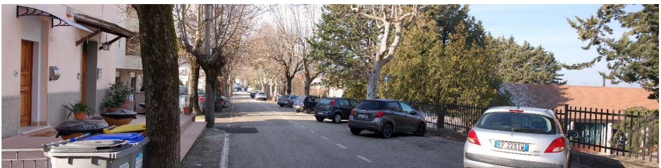
Foto n. 11 – Veduta a visuale ampia dal punto di accesso carrabile all’area scolastica di progetto. Le alberature esistenti collocate all’interno dell’area d’intervento, di cui si prevede la salvaguardia, ed i platani del Viale della Stazione riducono sensibilmente la percezione dell’edificato scolastico, impedendo la vista dell’asilo a due livelli e riducendo quella della scuola elementare ad un limitato scorcio. Il locale dislivello, pari a 3,71 metri, tra la quota del Viale della Stazione e la quota d’imposta dell’edificato esistente, quota che sarà la stessa dell’ampliamento di progetto, amplifica l’importanza percettiva e figurativa delle coperture, rendendole di fatto il quinto prospetto dell’edificato. Il progetto di ampliamento redatto ha assunto tale condizione come uno degli elementi fondativi, conferendo anche alle coperture una caratterizzazione percettiva e cromatica in continuità con il trattamento delle facciate. Data scatto: 05.01.2019