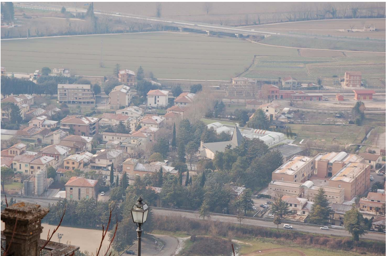
FOTOINSERIMENTO DEL PROGETTO