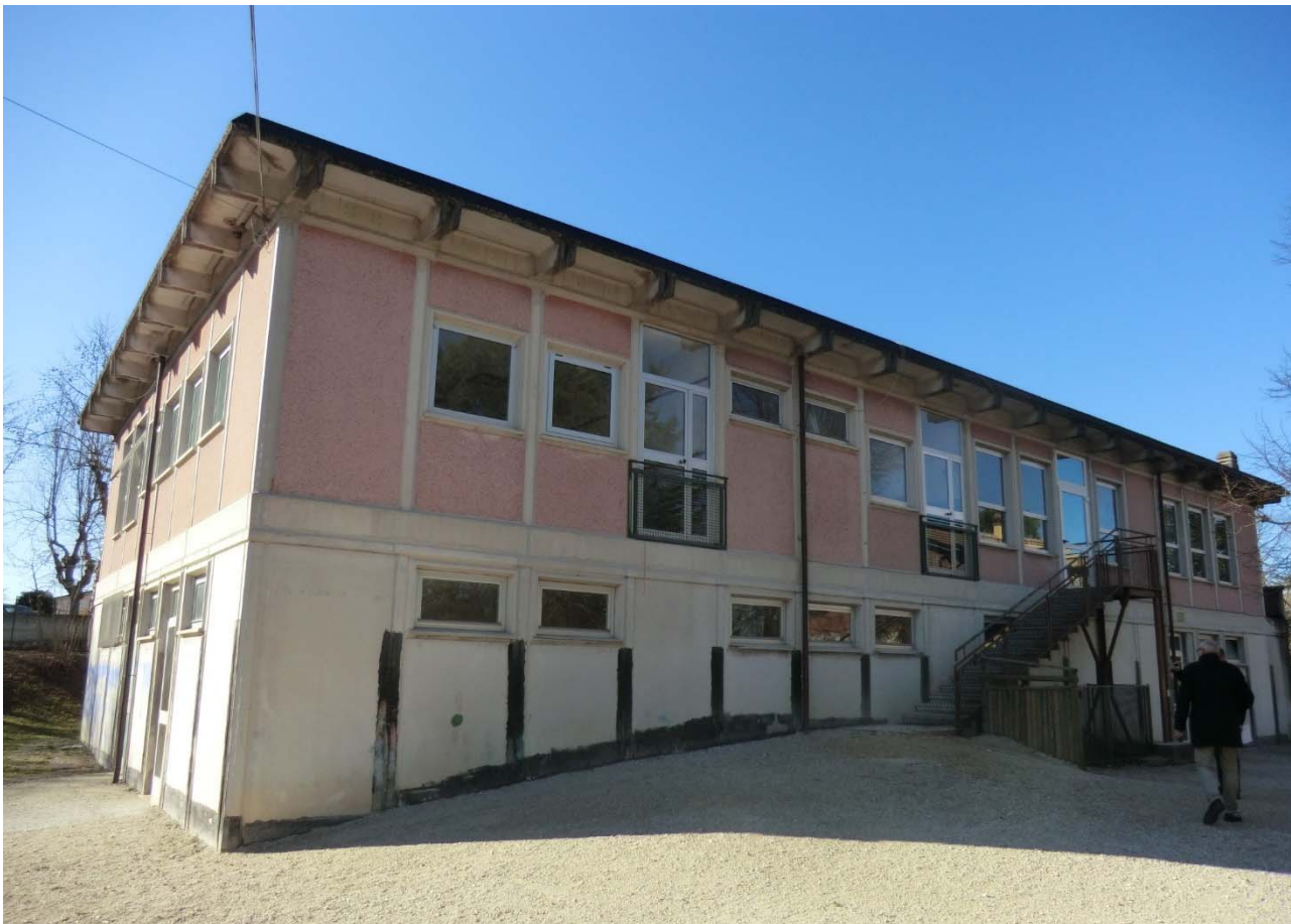
Foto n. 32 – Veduta dell'edificio della scuola materna di cui si prevede la demolizione, lato affacciato sull'area interna. Data scatto: 13.03.2015