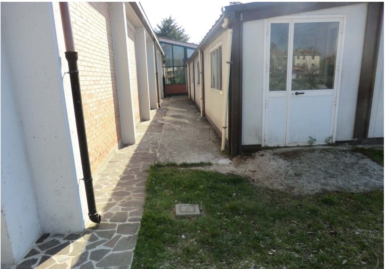
Foto n. 37 – Veduta in direzione sud dell'edificio della scuola elementare e dei contigui moduli prefabbricati di cui si prevede la demolizione/rimozione. Data scatto: 13.03.2015