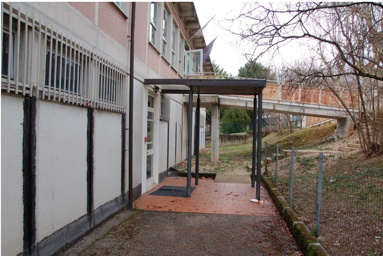
Foto n. 44 – Dettaglio dell'ingresso della Scuola Comunale di Danza attualmente accolta all'interno dell'edificio della scuola materna. Data scatto: 13.03.2015