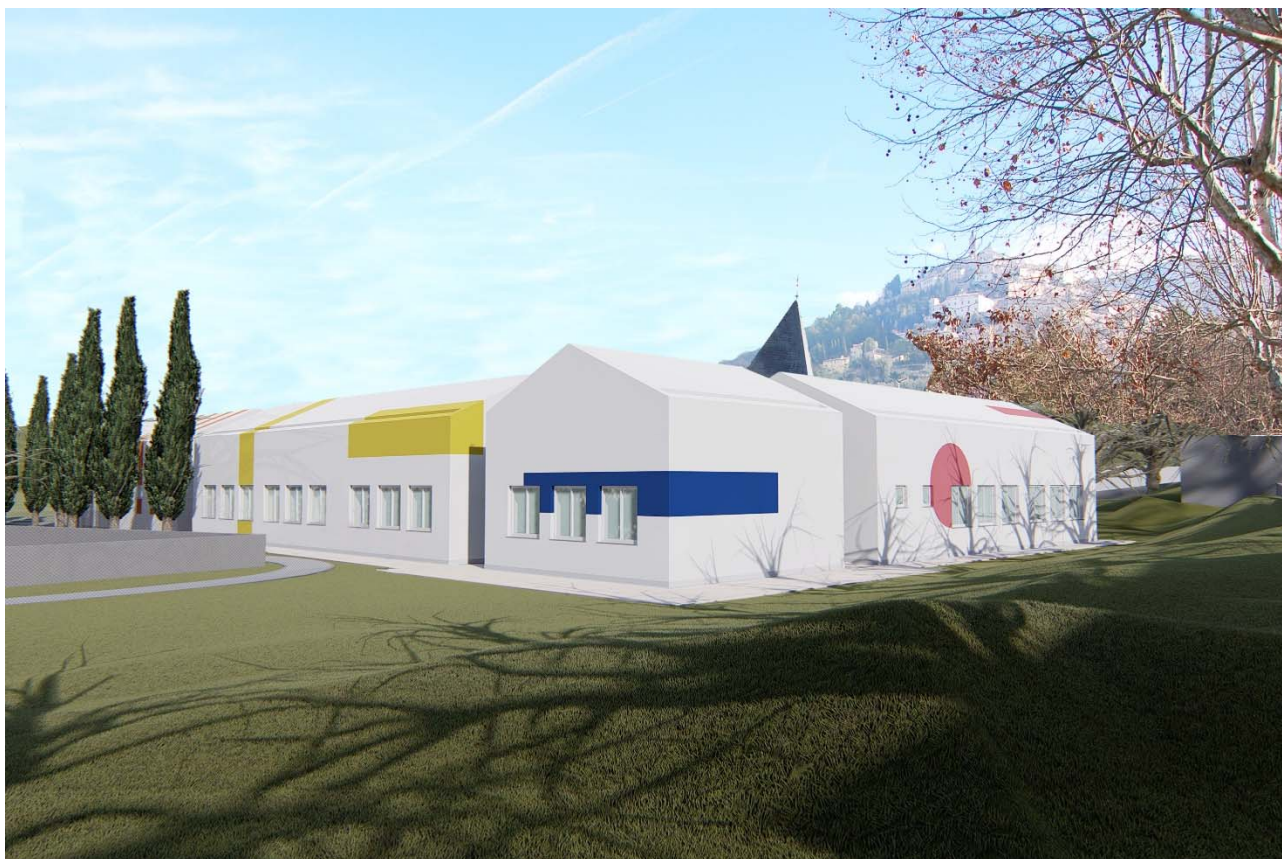
FOTOINSERIMENTO DEL PROGETTO