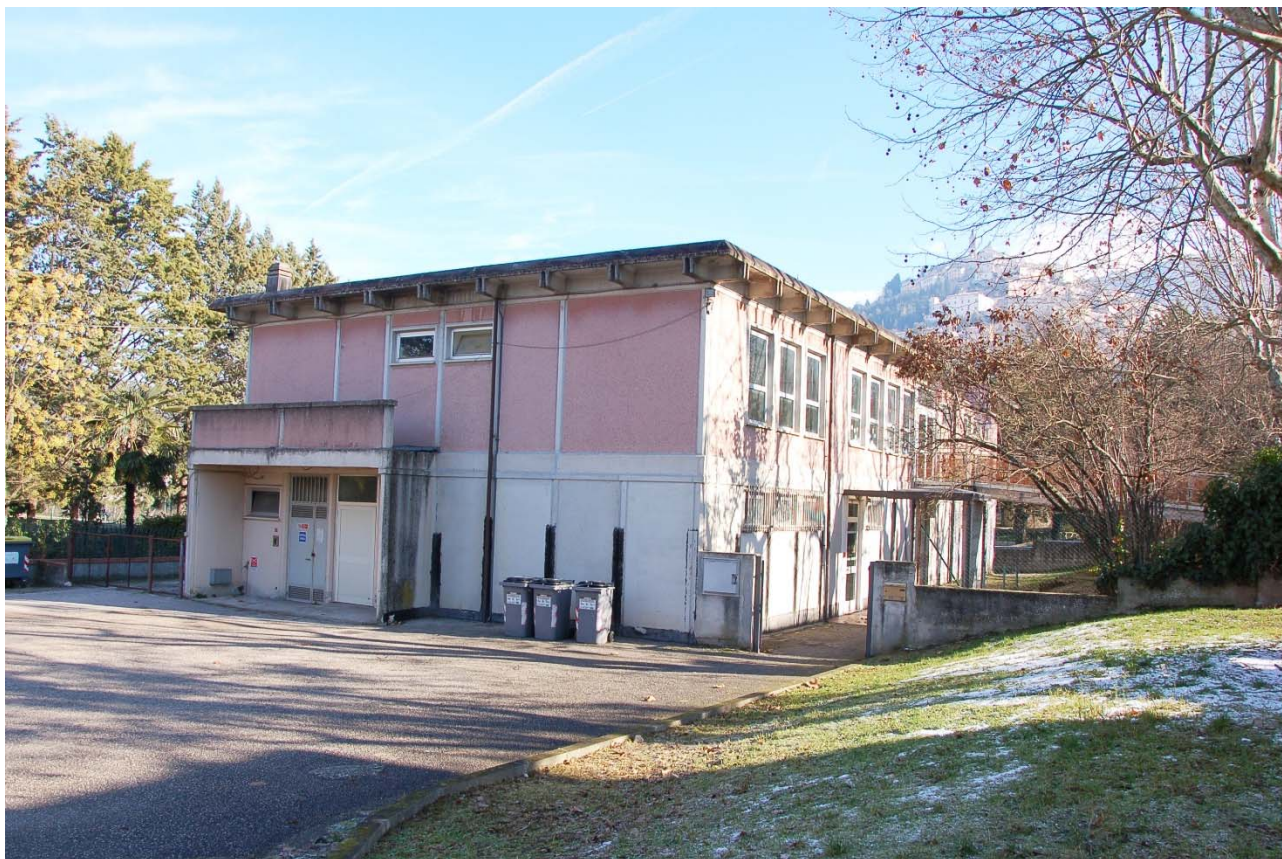
STATO ATTUALE di cui alla precedente Foto n. 49 Veduta in direzione est dell'edificio della scuola materna dall'ingresso del parcheggio scolastico.