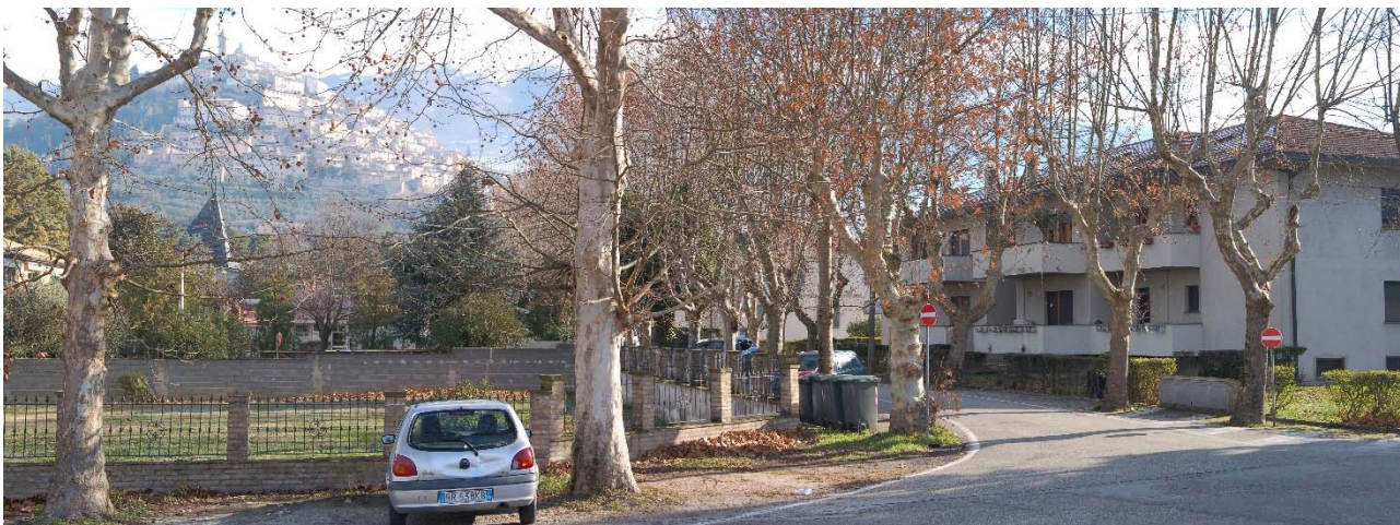
Foto n. 5 – Veduta a visuale ampia dalla zona della stazione ferroviaria della linea Roma-Ancona. Dell'area d'intervento ed edifici che vi insistono si intravede una limitata porzione di un'ala della scuola elementare, per effetto della spolazione stagionale delle alberature poste tra il punto di vista e l'area scolastica. Data scatto: 05.01.2019