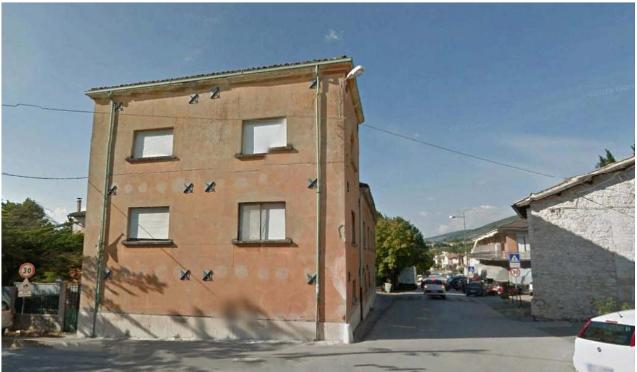
Foto n. 29 – Veduta dell’ultimo edificio posto sul lato sinistro di Viale della Stazione, risalendo verso monte, collocato sull’incrocio tra il Viale della Stazione e la Via Sant’Egidio, nonché scorcio della Chiesa di Sant’Egidio. Data scatto: 22.09.2018