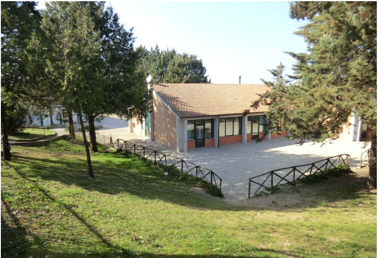
Foto n. 40 – Veduta in direzione nordovest dal Viale della Stazione.

Dall'immagine è desumibile il significativo esistente dislivello tra la quota d'imposta degli edifici scolastici e la quota del Viale della Stazione (3,71 m). Come pure è ben apprezzabile l'importanza delle coperture, sul piano percettivo e figurativo, che divengono il quinto prospetto dell'edificato, esistente e di progetto. In tal senso si rimanda ai contenuti della nota di accompagnamento della precedente Foto n. 11. Data scatto: 13.03.2015