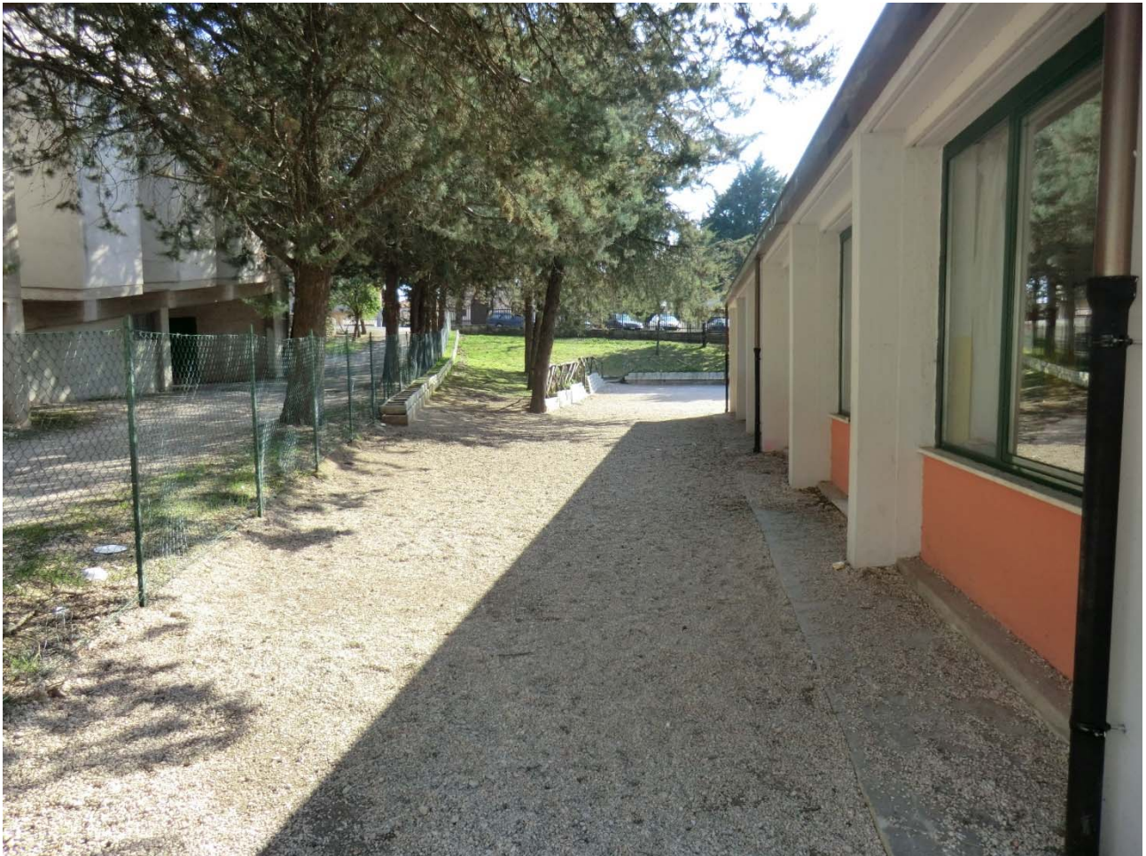
Foto n. 38 – Veduta in direzione sud dell’edificio della scuola elementare, del complesso della Chiesa della Sacra Famiglia e, sullo sfondo, del Viale della Stazione. Data scatto: 13.03.2015