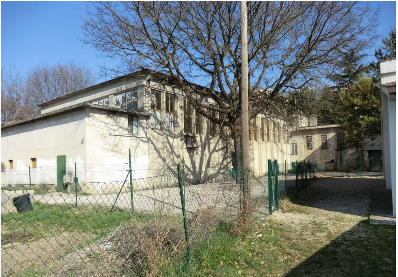
Foto n. 36 – Veduta della palestra parrocchiale posta a nord rispetto all'area scolastica. Data scatto: 13.03.2015