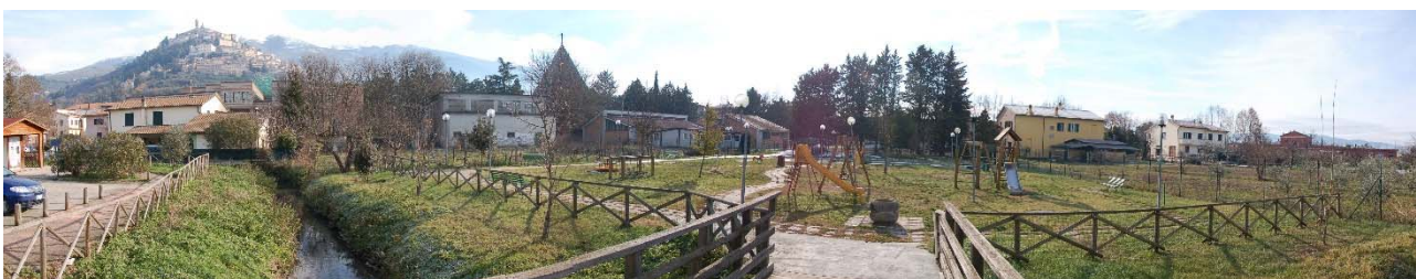
Foto n. 8 – Veduta a visuale ampia dal ponticello sul fosso Alveolo verso l'area a verde pubblico e il complesso scolastico. Nell'immagine diretta verso l'area d'intervento predominano: la copertura dell'aula liturgica della Chiesa della Sacra Famiglia e l'annessa palestra parrocchiale. Per la spolazione stagionale delle alberature è possibile intravedere l'attuale scuola elementare. Data scatto: 05.01.2019