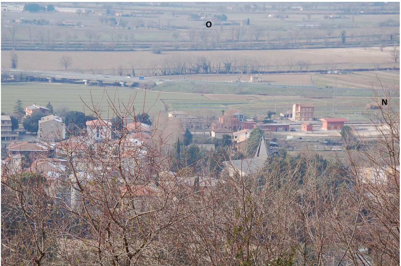
Foto n. 2 – Veduta da punto posto sul terrazzamento superiore a Via dei Monasteri (direzione Santa Chiara). Da tale punto di visuale è appena percepibile solo una parte della copertura dell'esistente edificio che accoglie la scuola materna, disposto su due livelli. Data scatto: 05.01.2019

L'area d'intervento e gli edifici che vi insistono, nonostante l'esistente edificio della scuola materna sia disposto su due livelli con altezza totale pari a 7 metri, non sono visibili per effetto: della folta vegetazione posta sul declivio sottostante e sino alla Via Flaminia, entro l'area di sedime della Chiesa Parrocchiale della Sacra Famiglia, lungo il Viale della Stazione; della rilevante altezza della copertura dell'aula liturgica della Chiesa stessa. Data scatto: 05.01.2019