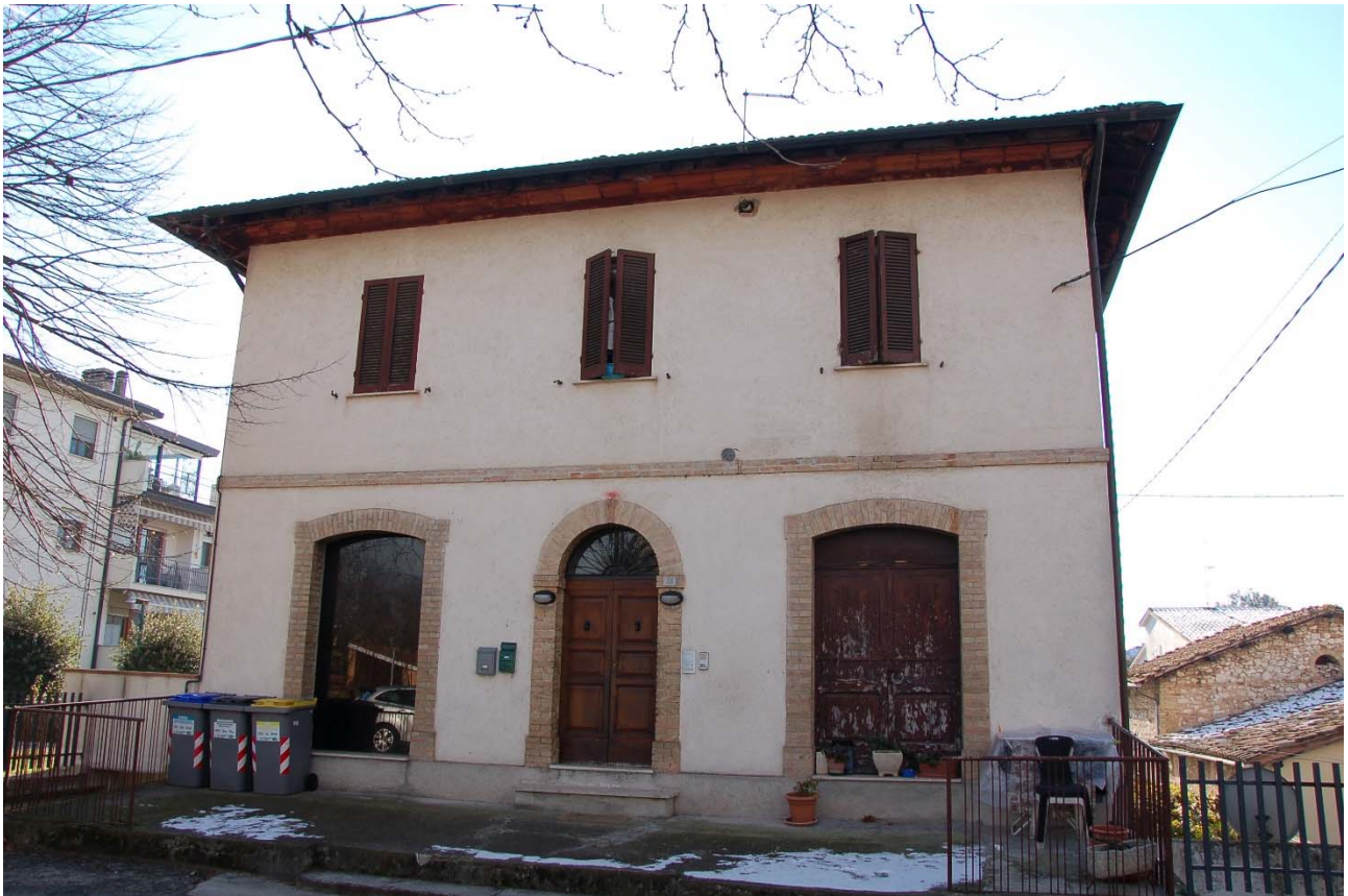
Foto n. 20 – Veduta del terzo edificio posto sul lato destro di Viale della Stazione, risalendo verso monte, frontistante all'accesso all'esistente parcheggio scolastico. Data scatto: 05.01.2019