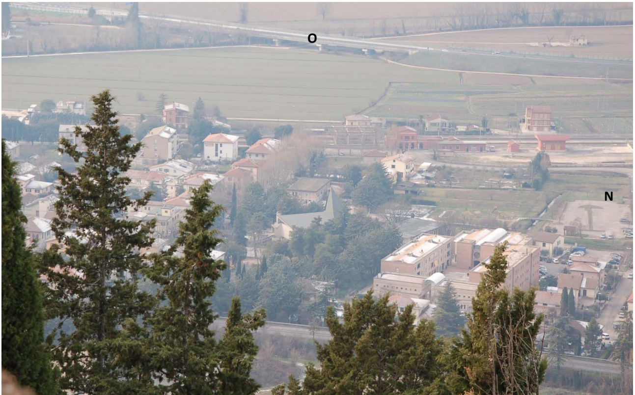
Foto n. 3 – Veduta da punto panoramico posto sulla Via Fantosati.

Dell'area d'intervento sono parzialmente visibili: l'esistente edificio a due piani della scuola materna; la porzione di area d'intervento posta ad ovest dell'edificio stesso (attuale parcheggio che sarà trasformato in area a verde e sede della greenway alberata); la porzione nord dell'area d'intervento (a destra rispetto alla copertura dell'aula liturgica della Chiesa). L'attuale scuola elementare, avente massima altezza identica agli edifici di progetto, non è visibile. Data scatto: 05.01.2019