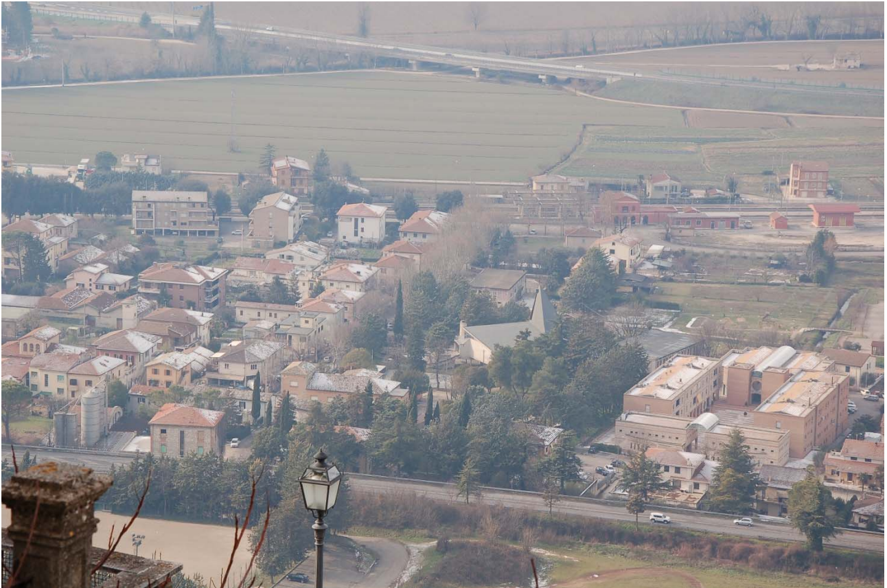
STATO ATTUALE di cui alla precedente Foto n. 4 Veduta dal punto panoramico posto sul terrazzamento superiore a Via Fantosati.