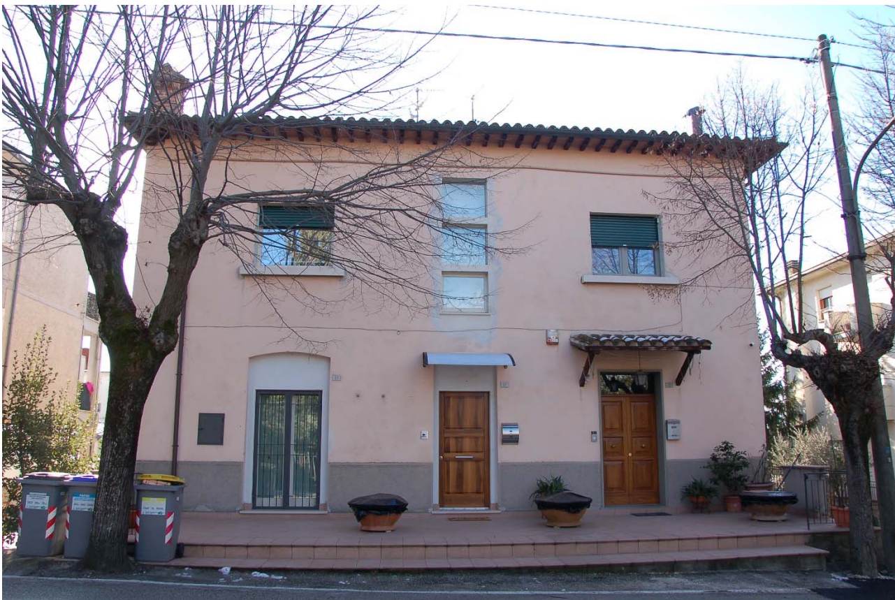
Foto n. 23 – Veduta del quinto edificio posto sul lato destro di Viale della Stazione, risalendo verso monte. Data scatto: 05.01.2019