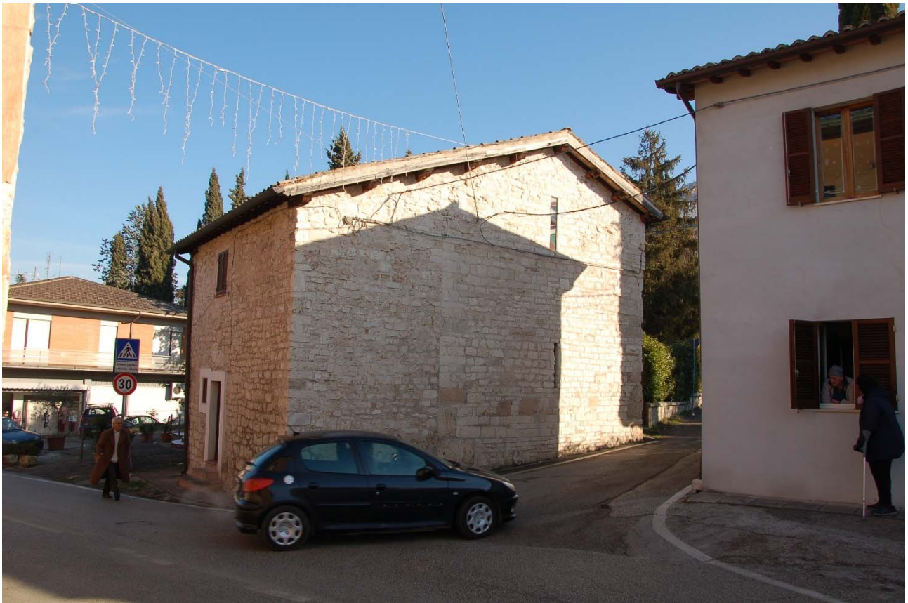
Foto n. 30 – Veduta della Chiesa di Sant'Egidio dall'incrocio stradale tra il Viale della Stazione e Via Sant'Egidio.