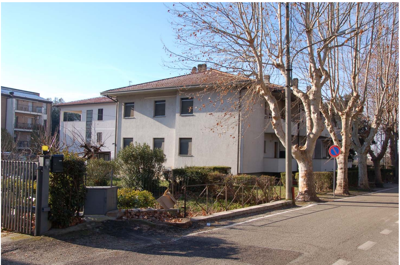
Foto n. 17 - Veduta laterale di monte del primo edificio posto sul lato destro di Viale della Stazione ed edifici retrostanti.