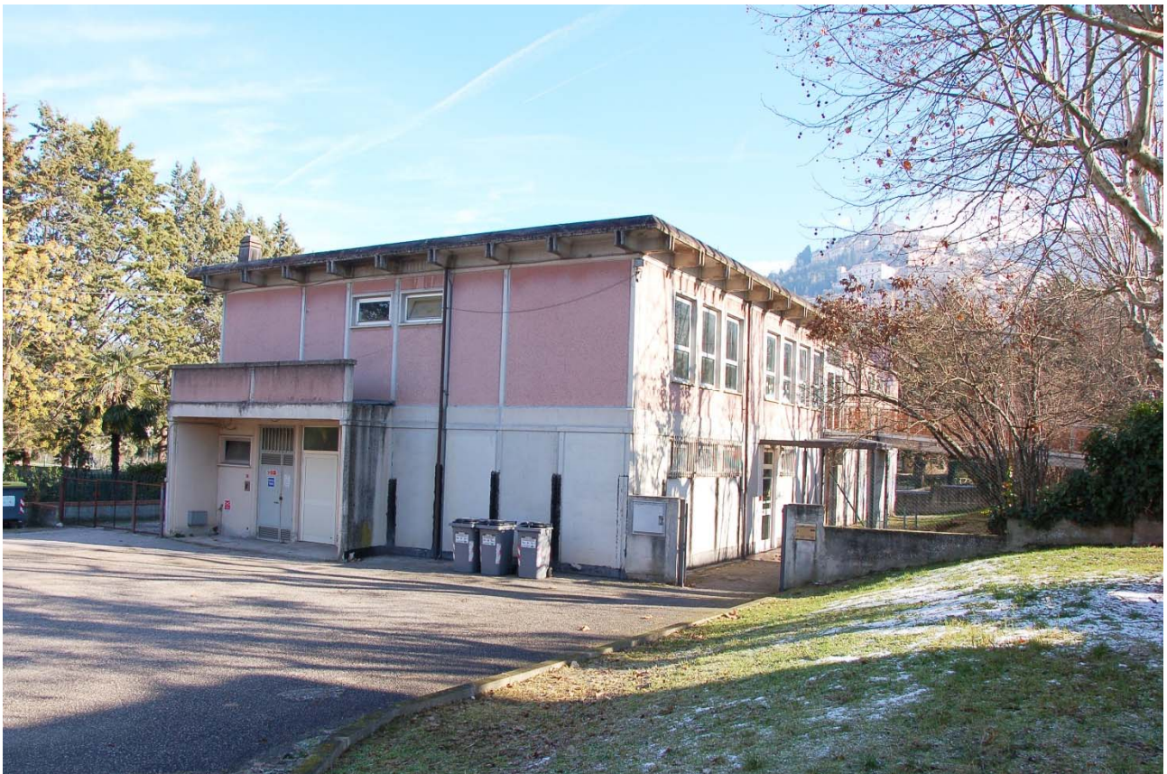
Foto n. 49 – Veduta in direzione est dell'edificio della scuola materna dall'ingresso del parcheggio scolastico. Questa immagine è stata utilizzata per la redazione di una delle elaborazioni infografiche di fotoinserimento di seguito allegate. Data scatto: 05.01.2019