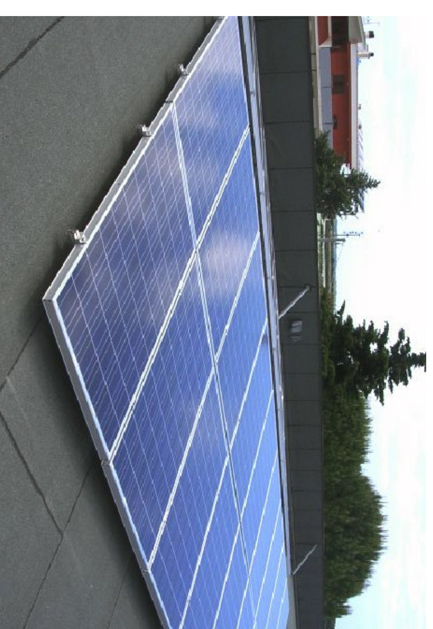
Impianto FV - foto installazione tipo su guaina