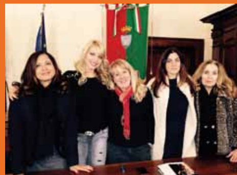
Trevi alla trasmissione Tv su Rai2 "Mezzogiorno in Famiglia"