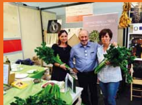
Salone del Gusto di Torino