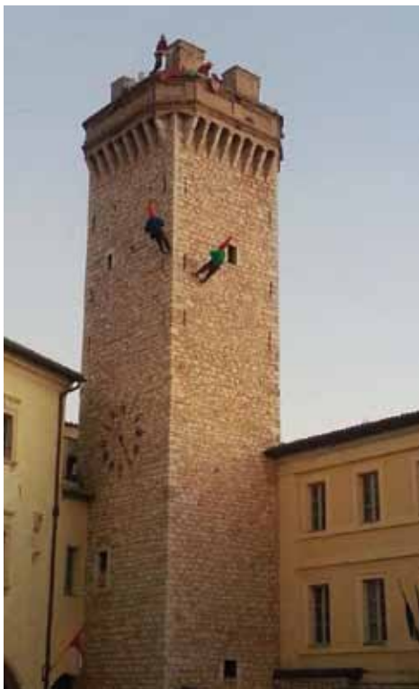
Pic&Nic a Trevi #artigianinnovatori

Tuttavia posso dire che abbiamo comunque con difficoltà svolto un buon lavoro, mi potreste dire "certo l'Assessore al Bilancio che deve fare se non difendere l'operato dell'esecutivo in ambito finanziario?" Però conoscendo bene la macchina comunale vi assicuro che non abbiamo fatto peggio di altri comuni e il tutto con moltissima fatica.