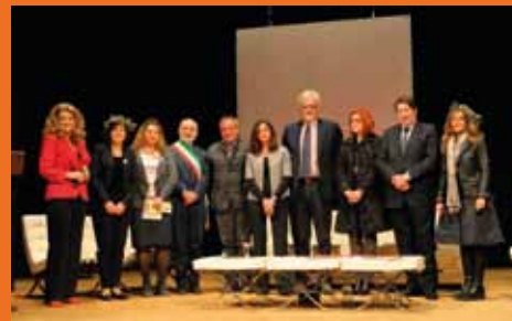
Premio giornalistico nazionale Report Gourmet