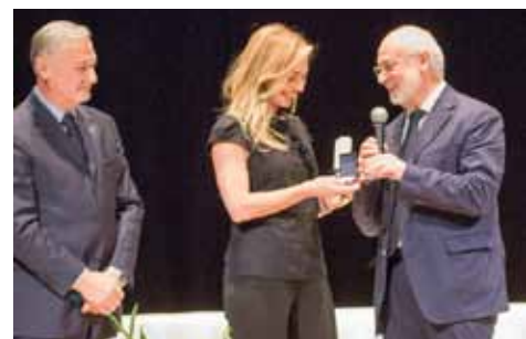
"Trevi premia un personaggio", medaglia d'oro alla giornalista Federica de Sanctis volto noto di Sky Tg 24.