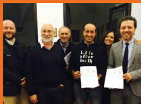
Contratto di Paesaggio