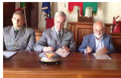
Firma del protocollo di intesa con la Guardia Forestale per i controlli contro l'abbandono dei rifiuti e i reati ambientali.

sindaco@comune.trevi.pg.it Tel 0742 332214